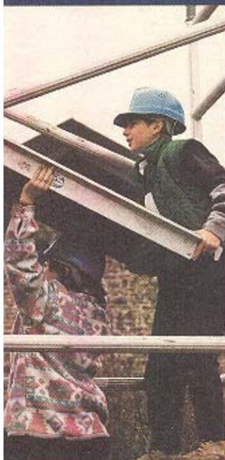
Travail en groupe : montage d'un échafaudage

Dirigé par l'Institut du Patrimoine wallon, le Centre de perfectionnement aux métiers du Patrimoine à Amay dispense des stages de perfectionnement à destination des professionnels du secteur de la construction et de la conservation du Patrimoine, dans une ancienne abbaye, propriété de la Région wallonne.