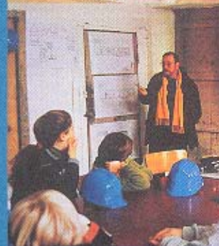
L'architecte explique son métier