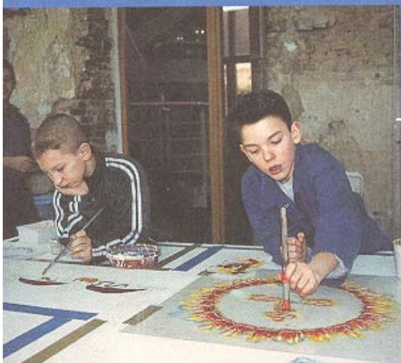
Atelier de peinture en décor

Centre de perfectionnement aux métiers du Patrimoine Rue Paix-Dieu, 1b 4540 Amay Tél 085 410 350 Fax 085 410 380 E-mail info@paixdieu.be www.paixdieu.be