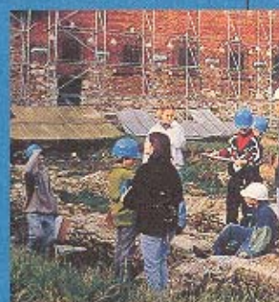
Découverte du site et des fouilles archéologiques

Les classes d'éveil sont reprises dans la catégorie «activités extérieures» de la circulaire n° 1255 du Ministère de la Communauté française du 12/10/05 (classes de dépaysement organisées dans le cadre des programmes d'études secondaires).